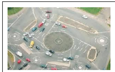
イギリス マジックラウンドアバウト